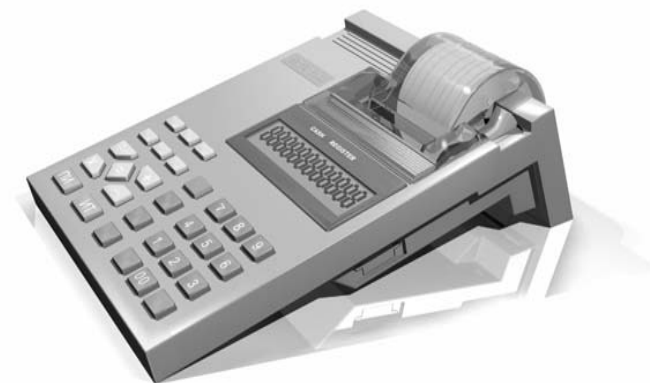
Контрольно-кассовая машина Меркурий-130К